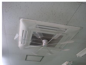
エアコン省エネ機器取付①