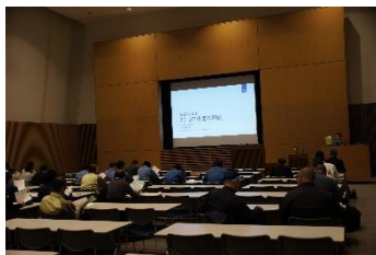
ISO 改定セミナー開催