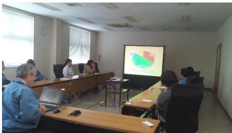
エコドライブ教習