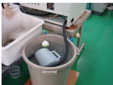
蒸留水製造装置冷却水再利用