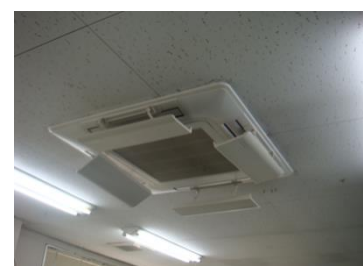
エアコン省エネ機器取付②