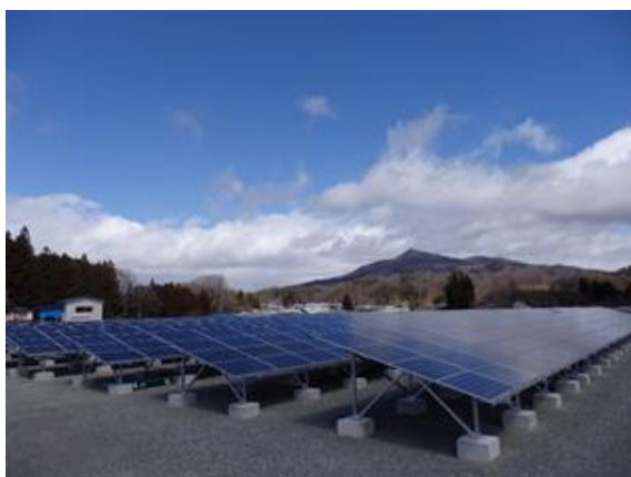
福島発電所 [ミツバクリエイティブ・グリーンLLP 有限責任事業組合への参画]