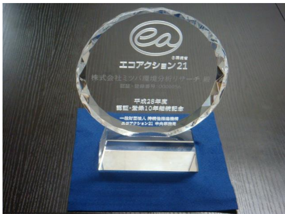
認証登録10年の表彰をいただきました。